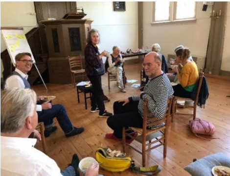
Tijdens de lunch met zelf gebakken en klaargemaakte gerechten

we andere, diaconale teksten. Eén over schuldhelpverlening, één reeks Bijbelteksten en een tekst van Trees van Montfoort over groene theologie. In groepjes van drie spraken we daarover. Weer bij elkaar probeerden we wat rode draden te ontdekken. Om er een paar te noemen: contact leggen en verhalen delen met elkaar en met diaconale projecten, zodat we bij elkaar betrokken