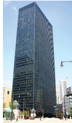
Van der Rohe

herkennen in dit kerkgebouw. We noemen dat samenvoegen van verschillende stijlen ook wel eclectisch. Dat is de ene 'koers' van de 19 e eeuw, de andere is gebaseerd op vernieuwende elementen en materialen. Deze vernieuwende koers/stijlrichting vond voornamelijk plaats in de VS o.a. bij architect Sullivan in Chicago. Deze richting wordt ook wel het functionalisme of modernisme in de architectuur genoemd. Een bekende uitgangspunt hierin was: "De vorm volgt de functie". Daarbij was bij hem (Sullivan) ook decoratie in opgenomen, maar zodanig dat de vorm ervan de functie van het gebouw volgt.