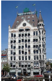
Witte Huis Molenbroek